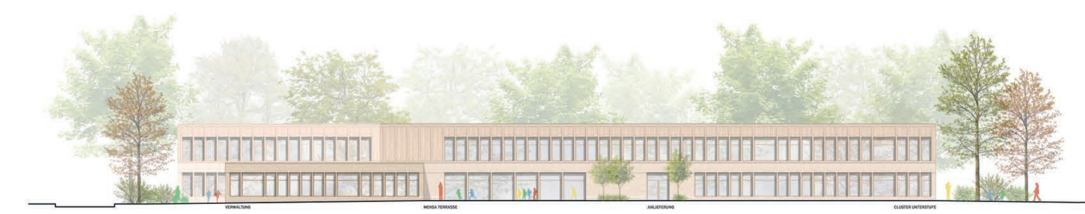
Ansicht West 1:200