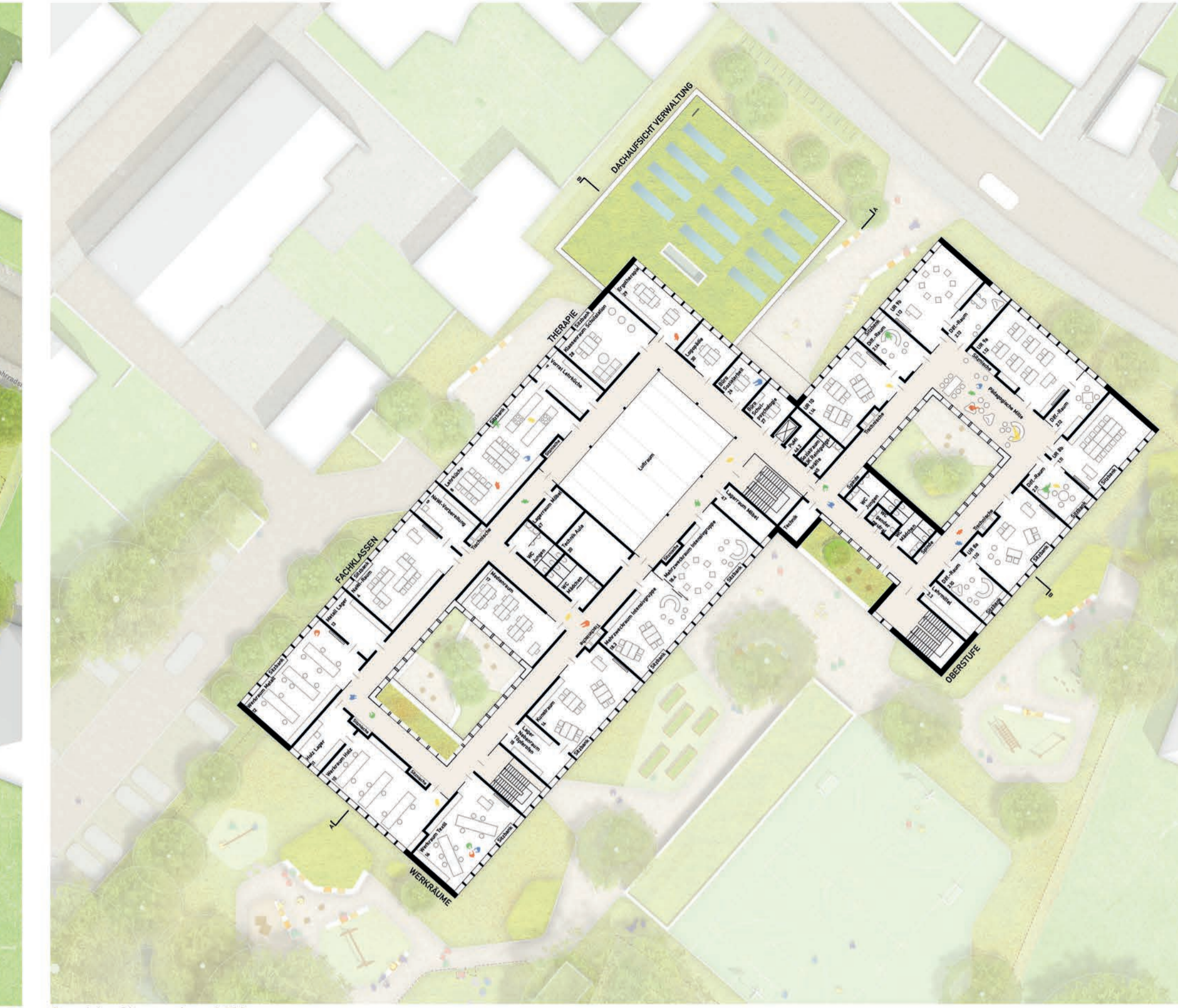
Grundriss Obergeschoss 1:200