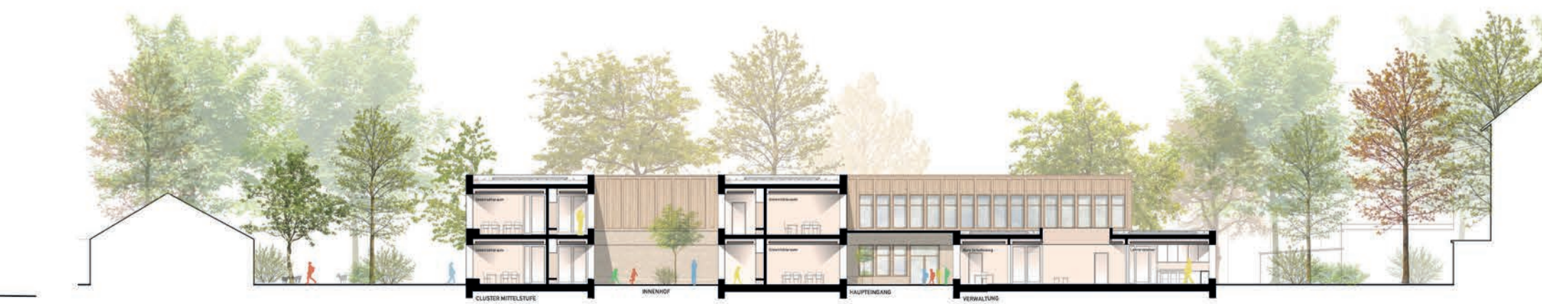
Schnitt BB 1:200