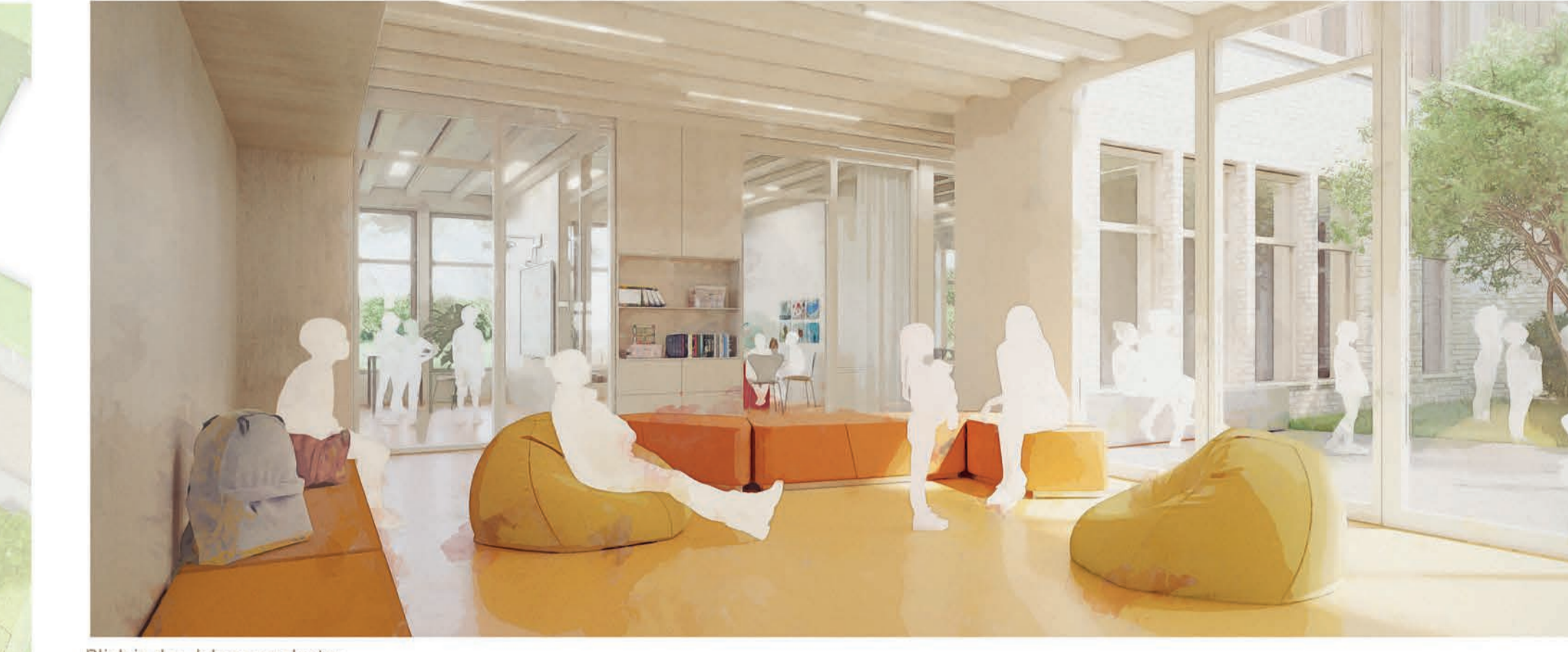
Blick in den Jahrgangcluster