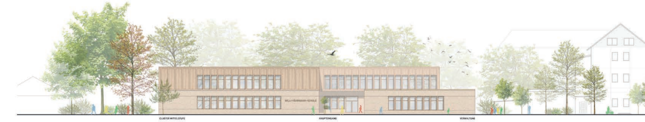
Ansicht Nord 1:200