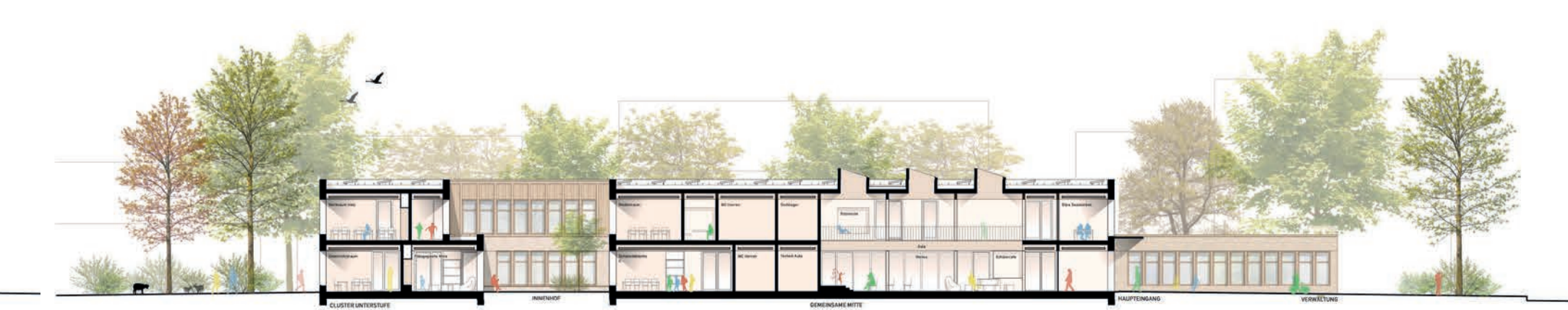
Schnitt AA 1:200