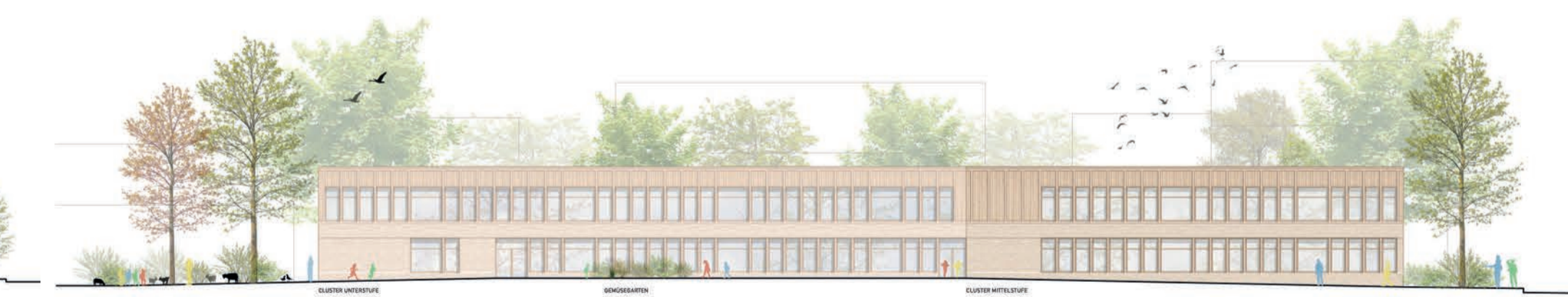
Ansicht Ost 1:200