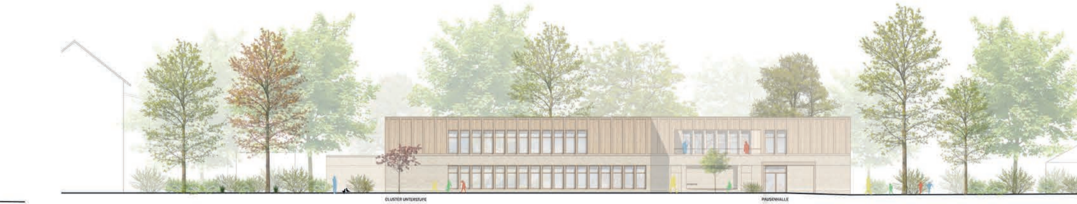
Ansicht Süd 1:200